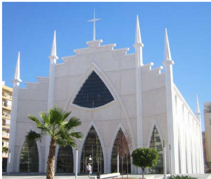
Denna undandömda moderniserade kopia av den gamla kyrkan hittar man till genom att följa Ramón Gallud från Stora torget norrut till korsningen med Calle Zoa och följa denna gata ett kvarter mot stranden.

Invånarna har under det sista året sett hur någonting som för oss nordbor ter sig som en blandning av Feskekörka och Taj Mahal börja ta form och som nu på rekordtid färdigställts och invigts med pompa och ståt några dagar efter midsommar.