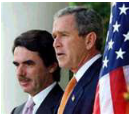
Besök hos Bush

Efter attentaten i Washington och New York den 11 september 2001 stödde den spanska regeringen helhjärtat USA i kampen mot terrorismen, såväl när man omgående gick in i Afghanistan som inför invasionen av Irak våren 2003. Befolkningen var däremot kluven. I Spanien liksom på många andra håll i världen ägde stora demonstrationer rum mot planerna på att med våld störta Saddam Hussein.