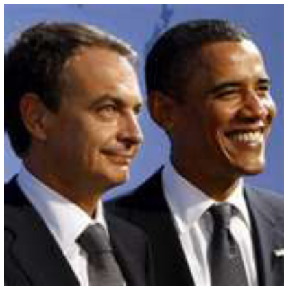
Zapatero med USA:s president Obama

På utbildningsområdet är en framträdande fråga obligatorisk undervisning i engelska från låg ålder. Det ansågs tidigare inte behövt, eftersom spanskan är ett världsspråk och t.ex. all högre undervisningslitteratur ändå finns tillgänglig. Att snabbt sätta engelskan på schemat har likväl inte varit lätt, eftersom tillgången på kvalificerade lärare ännu är begränsad. Inte heller dessa lärde sig språket som barn.