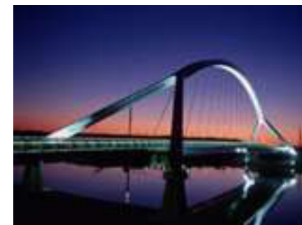
Puente de la Barqueta i Sevilla

villa en jättelik världsutställning. Allt detta blev framgångar av stora mått. Spanien var åter ett land att räkna med.