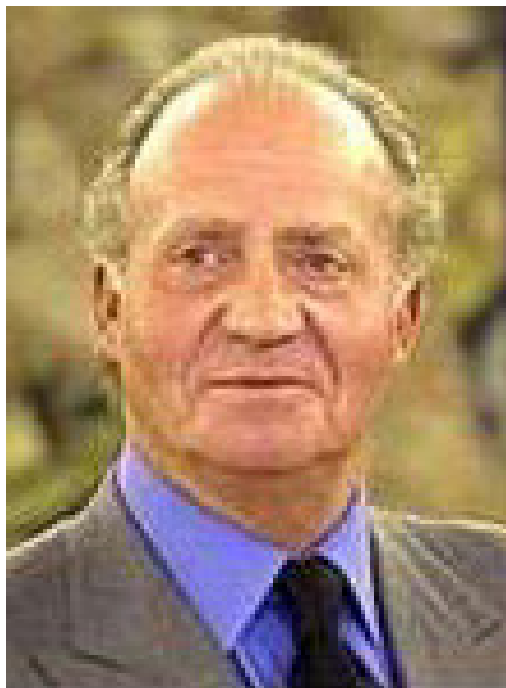
Kung Juan Carlos

När han som nybliven konung för första gången talade i parlamentet inledde han med ett tack till den bortgångne Franco och svor trohet till den fascistiska Falangens ideal. Men sedan lade han till den flertydiga meningen "Idag inleds en ny etapp i Spaniens historia". Den 37-årige monarken hade planer av helt annat slag än hans mentor avsett. Han ville lägga makten i folkets händer genom upprättandet av en konstitutionell monarki av engelskt snitt (kanske påverkad av fadern som var englandsvän). Detta kunde dock inte göras i ett enda steg, särskilt som flertalet i stats-