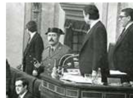
Suárez står kvar