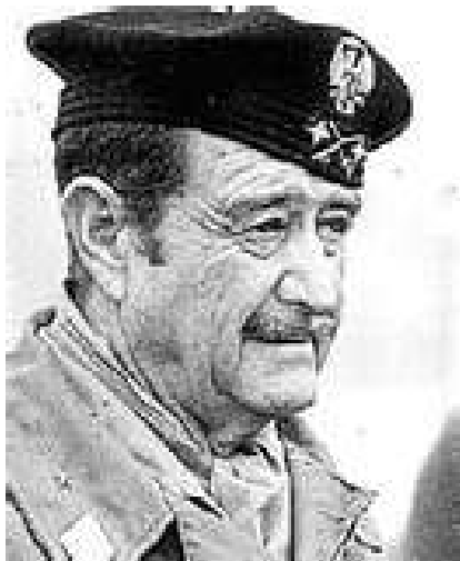
Milans del Bosch

Till ledarna för upproret hörde en general Jaime Milans del Bosch i Valencia. Han proklamerade genast utgångsförbud och kommenterade ut stridsvagnar på stadens gator.