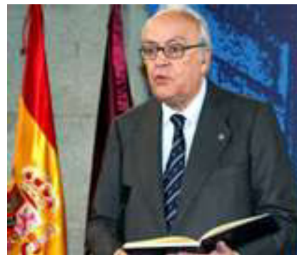
Leopoldo Calvo Sotelo

Då han i slutet av januari 1981 inlämnade sin avskedsansökan valde Juan Carlos som efterträdare Leopoldo Calvo Sotelo, dittills vice finansminister och en av Suárez nära medarbetare.